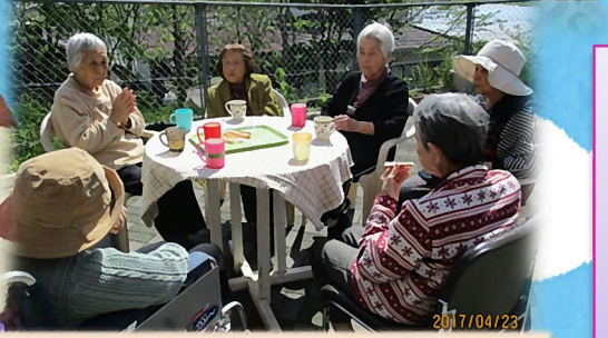
2号館畑横の遊歩道にてティータイム