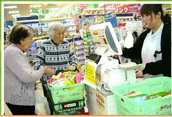
景品は3つの買物籠一杯のお菓子

3月恒例の「家族とのふれあい合同レクリエーション」を行いました。今年初の試みで企画の時点から家族に参加して頂き、参加家族全員に競技、ゲームへ利用者と参加してもらいました。その結果、参加者に一体感が生まれて、過去最高の盛り上がりとなりました。（家族のアイデアに感謝です。）