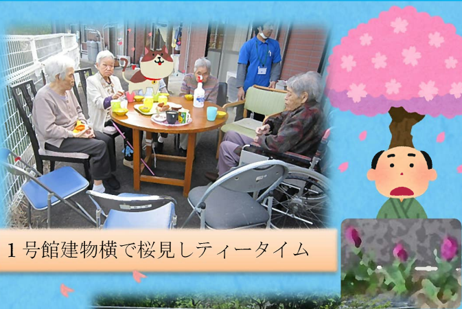
1号館建物横で桜見しティータイム

レクリエーション内容は、ノータッチボール、脳トレ、玉入れ競技でした。会場が1番笑いに包まれたのは、間違い探し時の利用者の名答（迷答?）でした。