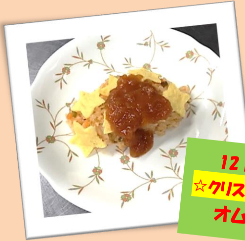
12月25日 ★クリスマス献立★ オムライス