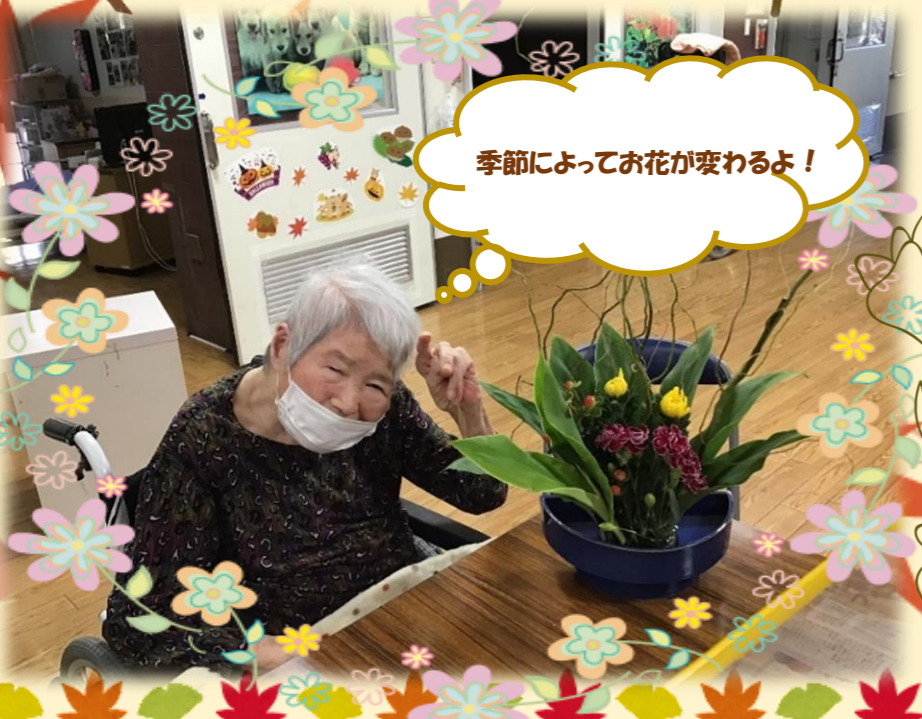
季節によってお花が変わるよ！