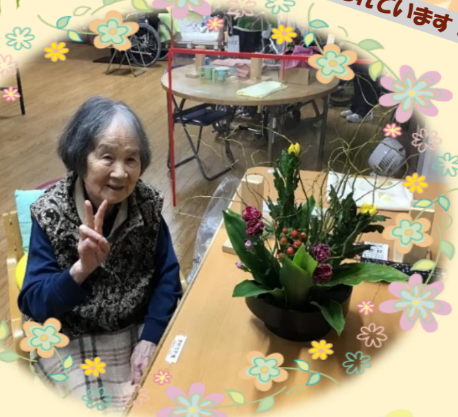
写真を撮るときのポーズが可愛いですね！！