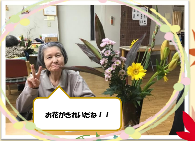
お花がきれいだね！！